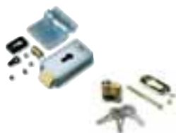
PLA10 serrure électrique 12V verticale (obligatoire pour battant supérieurs à 3m)