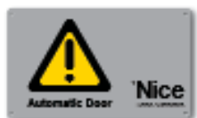
TS panneau de signalisation