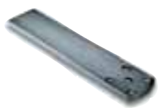
PLA6 patte de fixation arrière longueur 250mm