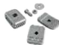
PLA13 fin de course mécaniques en ouverture et en fermeture