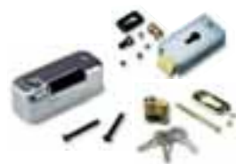
PLA11 serrure électrique 12V horizontale (obligatoire pour battant supérieurs à 3m)