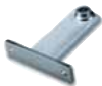
PLA8 patte de fixation avant à visser